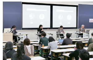
シンポジウム 「造形表現と人間形成」 2023年開催 対面開催