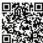
デジタルコンテンツ

展示やイベントなどの最新の情報は、ホームページのほか、Instagramでも発信しています。