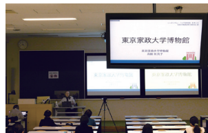
シンポジウム 『『大学博物館』を考える』 2022年開催 対面・オンライン開催

博物館の展示や所蔵資料を詳しく解説する講座のほか、展示などのテーマに合わせて、講演会やシンポジウムを開催します。