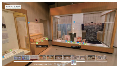
バーチャル展示室「裁縫雛形と自主自律の教え」