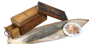
鯉節削り器・鯉節