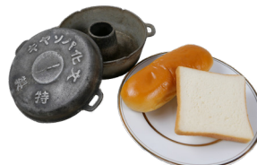
パン焼き器・パン

本展では、和食を支える伝統的な発酵食品と、それらを使用した郷土料理を、食品サンプルや写真とともに展示します。また、発酵を活用した染色技法である、藍染めや紅花染めについても紹介します。本展を通し、日本人の生活の身近にある発酵について、興味や関心を深めていただければ幸いです。